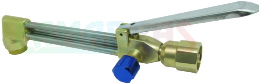
EXEMPLO DE MONTAGEM